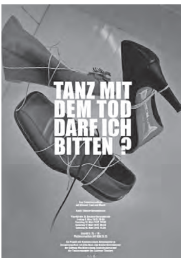
Plakatentwurf von Janek Egli: Schuhe, die an Schnüren hin und her tanzen – leblos, unheimlich. Ich wollte beim Betrachter Assoziationen zum Titel des Theaterstücks wecken.