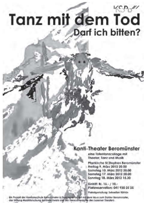
Plakatentwurf von Sebastian Röllin: Ausflug ins Nichts