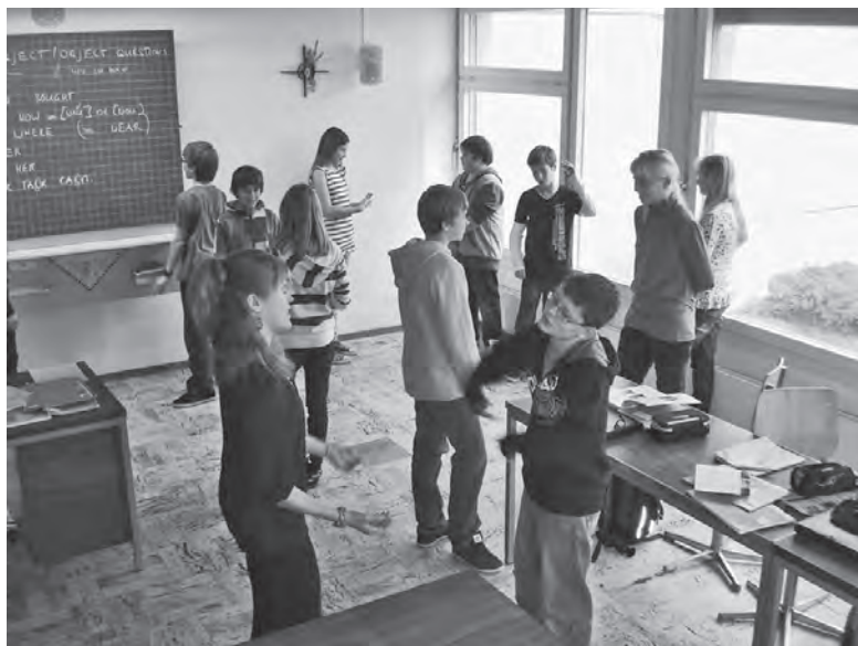
Schüler und Schülerinnen spielen mit Freude einen Dialog nach.